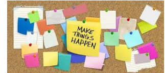
03 Pinnwand „Wir sind FitZ “